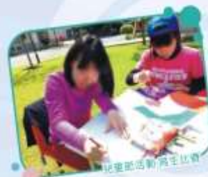
兒童節活動寫生比賽

終於放假了，這幾天要好好盡情的玩。這幾天的活動有畫畫比賽、吃鯛魚燒，而鯛魚燒有不同的口味，例如：紅豆、奶油、巧克力等……雖然我沒吃過，但我第一次吃到這麼好吃的美食，都令我感動，總有幸福的一天，我很感謝善心人士特地開車來到我們這裡，做給我們吃，另外也令我印象深刻的事是畫畫比賽，那時大家都努力的畫，有人在陽光的草地上，也有人在陰涼的走廊上，每個人都戰戰兢兢的畫，到最後每個人都畫出精彩繽紛的一幅畫，我覺得每個人畫畫天分好厲害，值得按個讚（還有令我感動的是在大太陽底下明亮的人們，都沒喊累呢！太棒了，沒看過這麼努力的他們）。星期二就是兒童節了，早上和下午我們都有飲料和點心吃，每個人都吃得津津有味，這些東西都是很少在吃的，但能享受到真是一種福氣，凡事多珍惜一切所有，少斤斤計較，所有東西都是值得感恩的，我覺得住在阿尼色弗的院童們都好幸福啊！每天都有善心人士來關懷我們，長大一定要「取之於社會、用之於社會」來回饋社會上的每一個人。