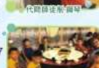
大馬路及聖潔電子書