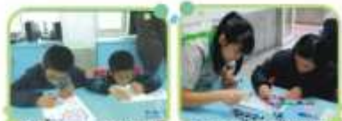
全家便利商店着色比賽

親愛的上帝，我要在基督裡常常更新我的身心靈，祢是道路、真理、生命，因為有祢，才会有今天的我。有一天我會離開阿尼色弗兒童之家，但我相信你不会離棄我，因為出生前祢已經認識了我，祝福永遠都存在，阿門。