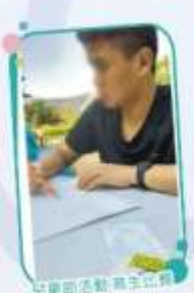
兒童節活動寫生比賽