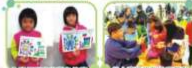
全家便利商店着色比賽