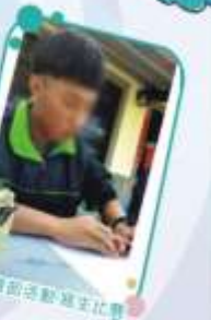
兒童節活動寫生比賽