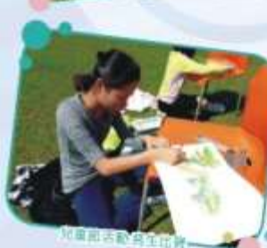
兒童節活動寫生比賽