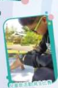
兒童節活動寫生比賽