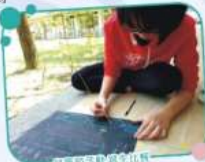
兒童節活動寫生比賽