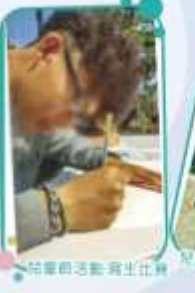
兒童節活動寫生比賽