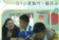
代爾德製餅-課業輔導