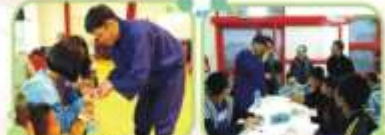
丹上真格來院分享互動