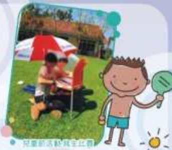
兒童節活動寫生比賽