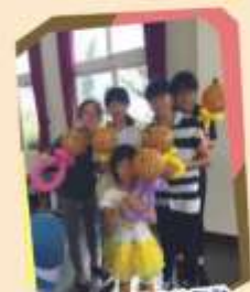
崇信獨立委來院互動