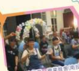
「GO勇敢起飛」畢業晚宴(南投)