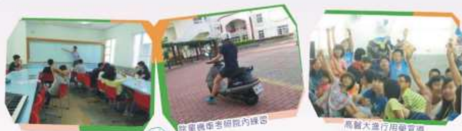
自立方案-保險與生活課程