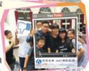
「GO勇敢起飛」畢業晚宴(南投)