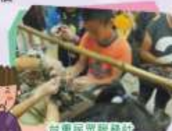
台東民眾服務社 端午節系列活動