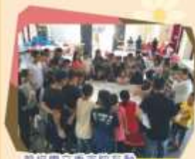
崇信獨立委來院互動

在國小我要謝謝每位老師和高老師，謝謝每位老師的教導。也謝謝高老師的教導，糾正我們不對的地方，當我們遇到困難時，您總是會為我們加油，陪我們一起解決。在國小最令我開心的就是去畢業旅行，過程中看到大家互相幫忙，也讓我開心了不少。學弟學妹們也成長了不少，變得越來越懂事了。回想這六年的時光，一路上我們有說有笑，但這些都將成為回憶。現在我們畢業了，要升上國中了，雖然不知道上了國中會發生什麼事，但是我會好好讀書，聽老師們的話，我會永遠記得老師們的祝福，常常去回想老師們說的每一句話，永遠放在心裡面。