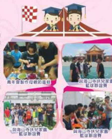
青年會製作母親節蛋糕

我畢業了，我自己有很多心得，而且自己有很大的機會可以讓我有一個目標前進才可以，我要把自己缺乏的地方把它補起來才可以，如果沒有補起的話就會一直缺乏下去。