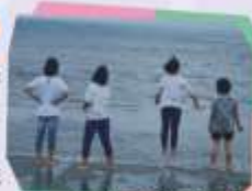
本院攝影班外拍活動

我想上的高中是高中的實用技能班，我填的是電腦繪圖科，我想朝著這個方向前進，也祝福畢業生，鵬程萬里，一帆風順，也祝高三的畢業生畢業快樂。