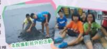
本院攝影班外拍活動