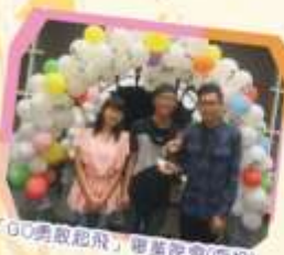
「GO勇敢起飛」畢業晚宴(南投)