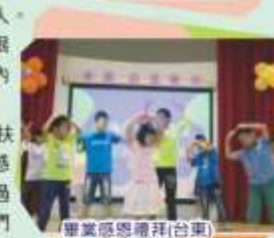
畢業感恩禮拜(台東)