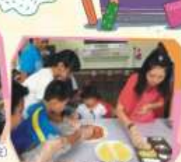
崇信獨立委來院互動