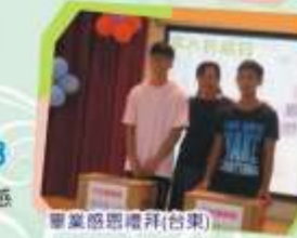
畢業感恩禮拜(台東)