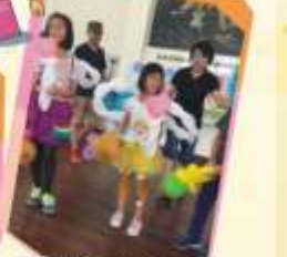
崇信獨立委來院互動