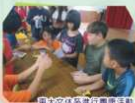
東大文休系進行團體活動

期待著未來的我能為著自己的夢想而努力，不要只一味的追求成功而傷了自己，偶爾的失敗可以累積經驗，現在的禱母不都走過這些坎坷的路才來的嗎？希望將來的我能成為有用之才。感謝在這裡的大人的教導，讓我現在的品德越來越好，也越來越有氣質等等。