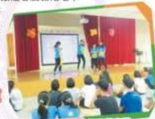
高職大進行用慶宣傳

我終於畢業了，雖然有點捨不得，但這是無法阻止的事，每個人都會經過生老病死，就像現在，每個人都要成長，沒有不成長這事。今天我從國小畢業，這是真正的開始，國小畢業只是一個小結束，現在要升上國中才是生命中真的開始。其實在國小這六年的時間，我感受到老師們細心的教導，也感受到學弟妹的溫暖和微笑，其實我要感謝的人有滿多的，像學弟們等等，他們帶給我很多愛和溫暖，很謝謝他們，也要感謝媽媽們細心的教導，雖然我還是住在院內，但這是謝謝他們用心來照顧我們，有些媽媽比較辛苦，家裡孩子有三個，但和他們見面的時間很少，媽媽真的很辛苦，謝謝你們。