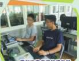
電腦文書處理軟體教學