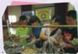
台東民眾服務社 端午節系列活動