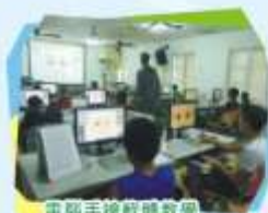
電腦手繪軟體教學

畢業，不是「結束」，則是一個新的「開始」，為自己開闢一片天，為自己打造一個高中生活。