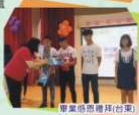
畢業感恩禮拜(台東)