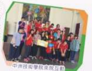
中洲技術學院來院互動