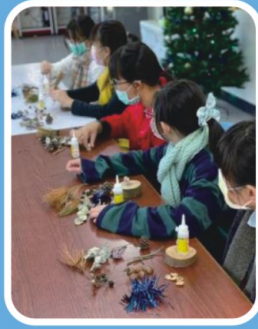
手作品也難不倒我