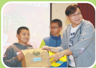
最喜歡聖誕禮物了