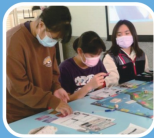
馴錢師理財規劃課程