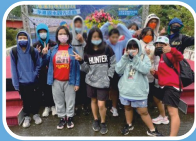
新武呂溪淨灘親水活動