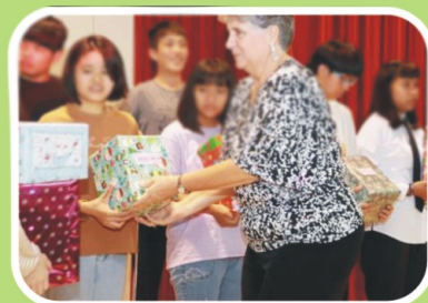
最喜歡聖誕禮物了