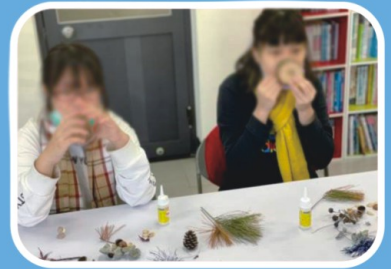
手作品也難不倒我