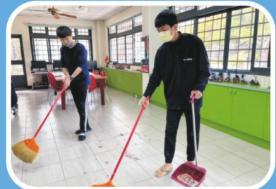
我們是家事小幫手