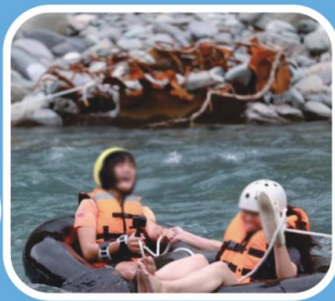
新武呂溪淨灘親水活動