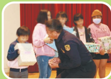
最喜歡聖誕禮物了