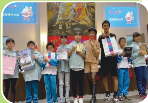
最喜歡聖誕禮物了