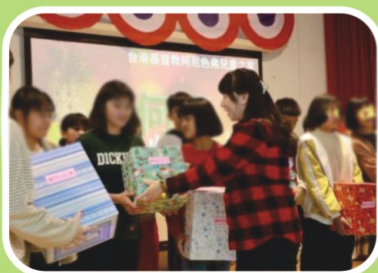
最喜歡聖誕禮物了