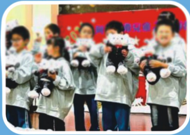
聖誕餐會開心聚集